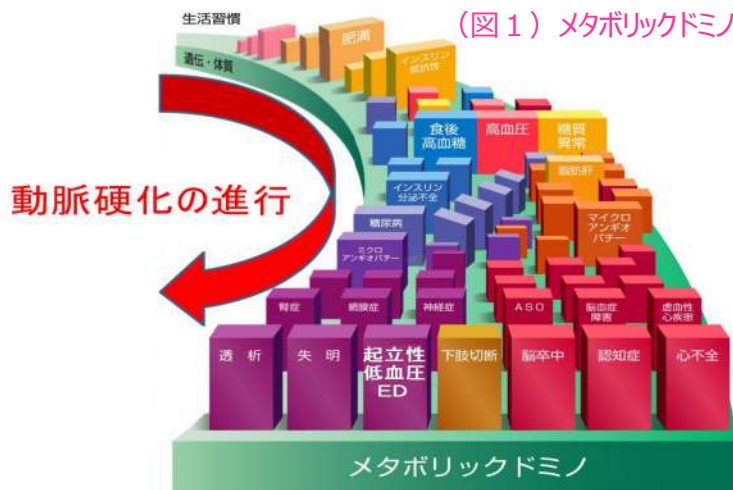
(図1) メタボリックドミノ