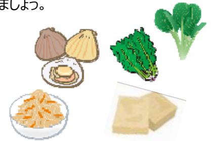
栄養科 管理栄養士 大平 真衣