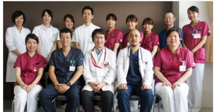
関節機能再建センター スタッフ