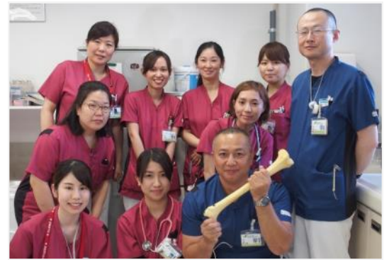
6階東病棟 スタッフ

整形外科の患者様の多くは、ケガや病気により歩けなくなるなど運動機能が低下します。そのため、看護師は入院時より「玄関まで階段は何段あるのか」「ベッドまたは布団で寝ているのか」などとご自宅の状況や暮らしの場所を