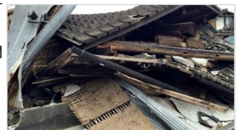
地震で倒壊した家屋