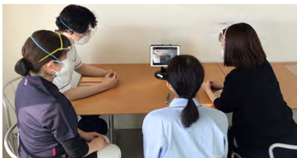
オンラインでのカンファレンス

ご自宅や施設へ退院する患者さまの中には、その後も継続して医療処置や身体的ケア・介護を必要とする方が多くいらっしゃいます。退院後、安心した生活を送るためには、退院前に患者さまに関わる人が集まり、入院中の状況や退院後に必要なサービス等について話し合いの場を持つことが大変重要です。