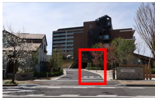
クレールレジデンス入口 停留所 旧みどりさくら保育園停留所の向かい側です。