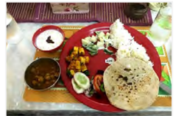
インドの家庭料理

学会開催場所はインドの南の西海岸「マニパル」という町で、気候は横浜に似ていて、それほど暑くありません。食事は基本、3食カレーですが、スパイスが効いていてとても美味しかったです。