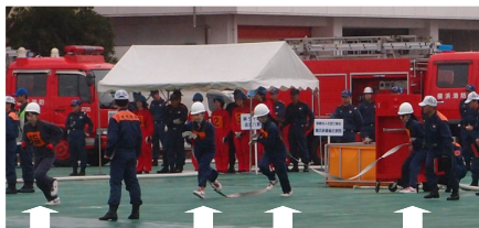
指揮者 一番員 二番員 三番員

2階に新規オープンした人間ドック・健診センターでは ①専任の医師・看護師を増員 ②一般の患者様と共有していた検査機械の一部をセンター内に導入し、よりご満足いただける環境づくりを目指しました。ホームページも写真を多く取り入れ、よりわかりやすくリニューアルいたしました。是非、ご覧ください。お問合せ：人間ドック・健診センター (直通) 045-984-3003