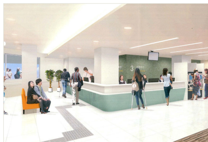
受付周辺完成予想図

専門：日本循環器学会専門医 日本外科学会専門医・指導医 日本胸部外科学会認定医 医学博士